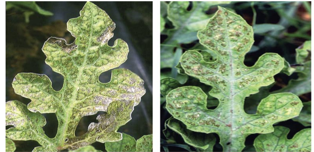
Daños de ozono en sandía

mente en los cultivos del área mediterránea. Es por esto, por lo que se hace cada vez mas necesario e imprescindible que los procesos de selección y mejora se realicen en las propias zonas de cultivo ya que de esta forma además de conocer el comportamiento frente a los posibles agentes patógenos y contaminantes atmosféricos permitiremos a los cultivos poner en marcha sus propios mecanismos de adaptación al tiempo que valoramos la importancia real de estas interacciones.