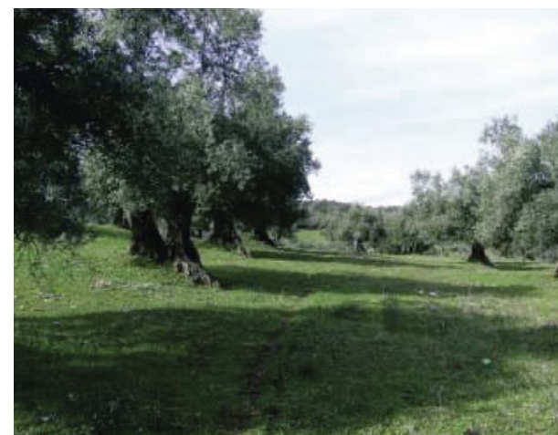
Las cubiertas vegetales son clave para el mantenimiento de la capacidad del suelo como filtro biológico de plagas.

En otros casos se ha podido establecer la relación del mantenimiento de cubierta vegetal con los problemas de ácaros. En efecto se ha comprobado que las cubiertas vegetales suelen mantener en general altas poblaciones de fitoseidos depredadores que en función de las condiciones ambientales ejercen una función reguladora se distintos tipos de ácaros bien sobre la propia cubierta o bien desplazándose hacia los cultivos.