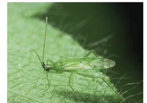
Los miridos, muy abundantes en los ambientes mediterráneos, son importantes depredadores de moscas blancas

Esta técnica consiste en aprovechar la capacidad que tenga un agro-sistema manipulándolo o no para que se favorezca la permanencia en el de los enemigos naturales ya presentes y así se pueda regular las poblaciones de plagas y mantenerlas a niveles bajos. La estrategia consiste en conservar y activar la presencia, la supervivencia y la reproducción de los enemigos naturales nativos que están presentes en un cultivo, a fin de incrementar su impacto sobre las plagas. Las posibilidades de incrementar las poblaciones de artrópodos benéficos y de mejorar su comportamiento depredador y parasítico efectivo, son viables a través del manejo de setos, ribazos, cubiertas vegetales que les brinde