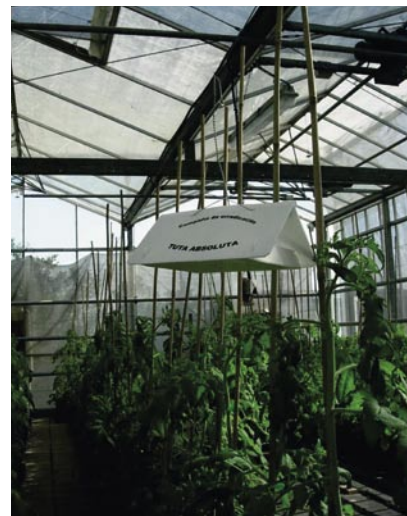
Trampa delta para el seguimiento de Tuta absoluta